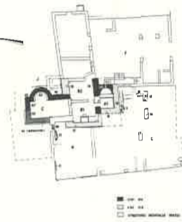
Faucon, Saint-Germain l'édifice roman des XII e -XIII e siècles.