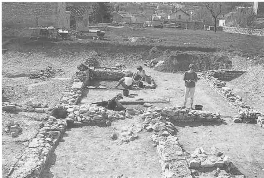
Vaison-la-Romaine fouilles au quartier de la Villasse.