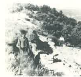
Saint-Saturnin d'Apt, Perréal fouilles anciennes (vers 1960)

Les plus spectaculaires sont les restes d'une maison de grandes dimensions ouverte au sud sur un jardin et bordée par une rue au nord. Les sols de la plupart des pièces de cette maison sont recouverts de pavements mosaïqués noir et blanc ou polychromés à décor géométrique et végétal. Malheureusement l'état de conservation n'est pas très bon. Sous cette maison existe vraisemblablement d'autres vestiges qui seront fouillés dès que les mosaïques auront pu être déposées par l'atelier de Saint-Romain-en-Gal. En l'état de la fouille, outre cette maison, un carrefour de deux rues semble pouvoir être mise en évidence. Si elle se confirme, la découverte est d'importance, elle permettra de préciser le parcellaire antique de la ville et d'avancer dans la réflexion sur le module de construction qui a pu être choisi. Cette fouille en cours est financée par l'Etat, le département de Vaucluse et la ville d'Orange. Précisons qu'elle occupera plus de 15 salariés durant deux mois de travail de terrain et plusieurs mois pour cinq archéologues, de travail d'atelier et laboratoire après la fouille. Une troisième tranche aura lieu en 1990 quand le pâté de maisons restant inclus dans le périmètre de la zone de Résorption de l'Habitat Insalubre, sera détruit.