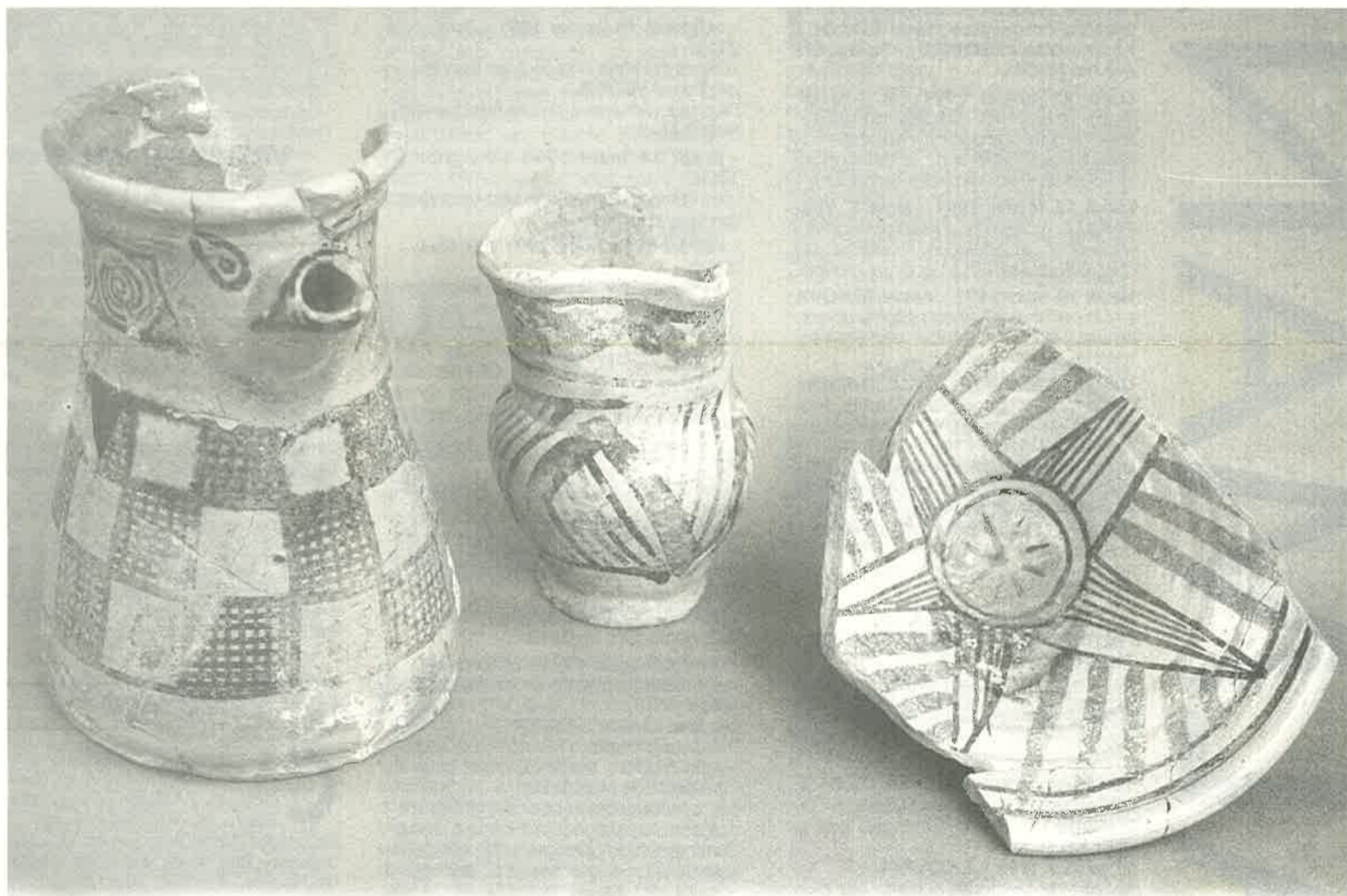
Avignon, rue Carreterie : céramique verte et brune du XIVe siècle.