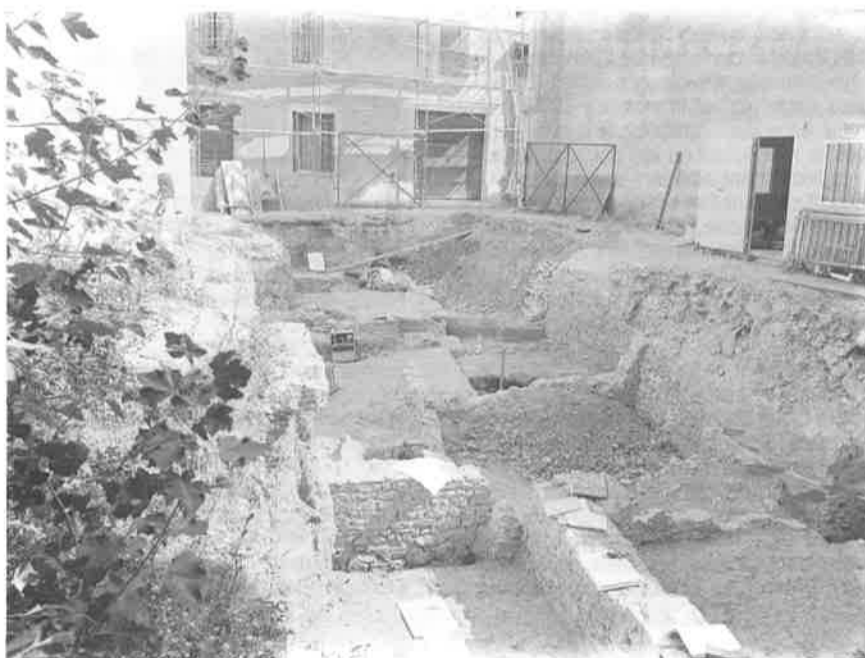
Cavaillon, centre ville : vue générale du chantier de la rue Michelet.

D epuis le début du mois de novembre 1990, le service d'Archéologie dispose d'un bulletin d'informations sur minitel que l'on peut consulter par le 36 14 Code CGV84. Le menu général apparaît. Il comporte 7 choix possibles : taper Y. Page suivante : taper 1. On trouvera régulièrement mis à jour, tous les renseignements sur les actions du service, les manifestations dans le Département et les titres des dernières acquisitions de la bibliothèque.