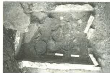
Cavillon, Bournissac : caisson funéraire, urnes et dépôts votifs sur place, fin du 1 er s. av. J.C.

En revanche, les bâtiments qui s'élevaient de part et d'autre de la rue antique retrouvée dans le chantier «Michelet», ont pu être observés sur une superficie relativement large. C'est ainsi que l'évolution, entre les années 30-20 avant J.C. et le 1 er siècle de notre ère, des pièces qui bordent le côté nord de cette rue a été suivie avec précision. Elles sont tout d'abord largement ouvertes sur la voirie et constituent sans doute des boutiques. Ultérieurement fermées, elles sont utilisées comme réserves. Le fond de plusieurs jarres semi-enterrées était encore en place au moment de la fouille. Dans un dernier temps, elle constituent des courettes et des puits y sont creusés. L'un deux, de construction particulièrement soignée, a été fouillé jusqu'à la nappe phréatique. Il était entièrement comblé et contenait notamment des tessons du début du 1 er siècle qui semblent bien attester un abandon du quartier dans le courant de ce siècle.