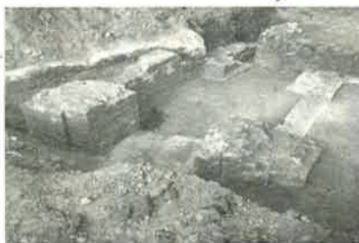
Orange : vue partielle des vestiges de l'amphithéâtre.

- Une occasion exceptionnelle nous était offerte d'étudier en extension l'occupation soudaine d'un espace auparavant libre de construction. La répartition des maisons est rationnelle, selon un plan orthogonormé, obéissant à de strictes règles d'urbanisme. Entre deux rues