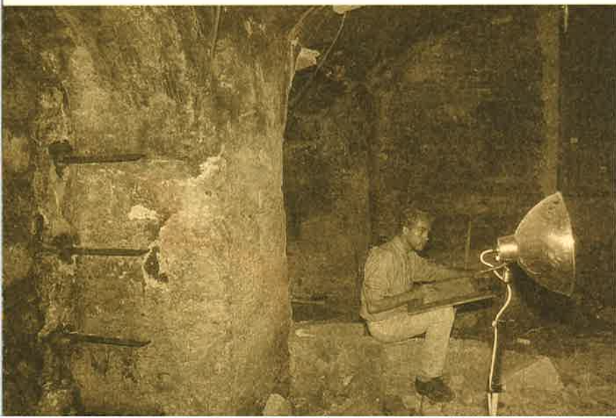
Avignon, rue Favart travail de relevé