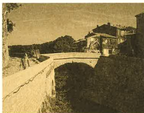
Vaison-la-Romaine, le pont restauré

Dans le cadre d'une prospection archéologique des cavités karstiques des plateaux de Vaucluse, un sondage limité a été pratiqué dans l'aven du Fraysse à Sault. La cavité, située à 500 m environ au sud de l'aven des Fourches I (en cours de fouille depuis 1990), se développe sub-horizontalement sur une vingtaine de mètres, pour déboucher sur le fossé de Sault, à une trentaine de mètres au dessus du lit actuel de la Nesque. Cette première évaluation a permis de recueillir de précieuses informations sur le remplissage de ce conduit et de récolter un mobilier peu abondant, essentiellement constitué de fragments céramiques très corrodés et de quelques pièces lithiques attribuables à la fin du Néolithique. Cette découverte confirme l'importance du potentiel archéologique et paléontologique de ce secteur, où près de 75 avens, sur la seule commune de Sault, sont d'ores et déjà recensés par les spéléologues et les hydrogéologues. Ces nombreuses formes hypogées situées en bordure du fossé de Sault, ont une profondeur modeste mais possèdent un développement horizontal relativement important, propice à des utilisations diverses (sépultures et stockage dans l'aven des Fourches I par exemple). Leur étude devrait permettre à terme de mieux cerner la nature des fonctions de ces cavités durant le Néolithique et l'Age du Bronze.