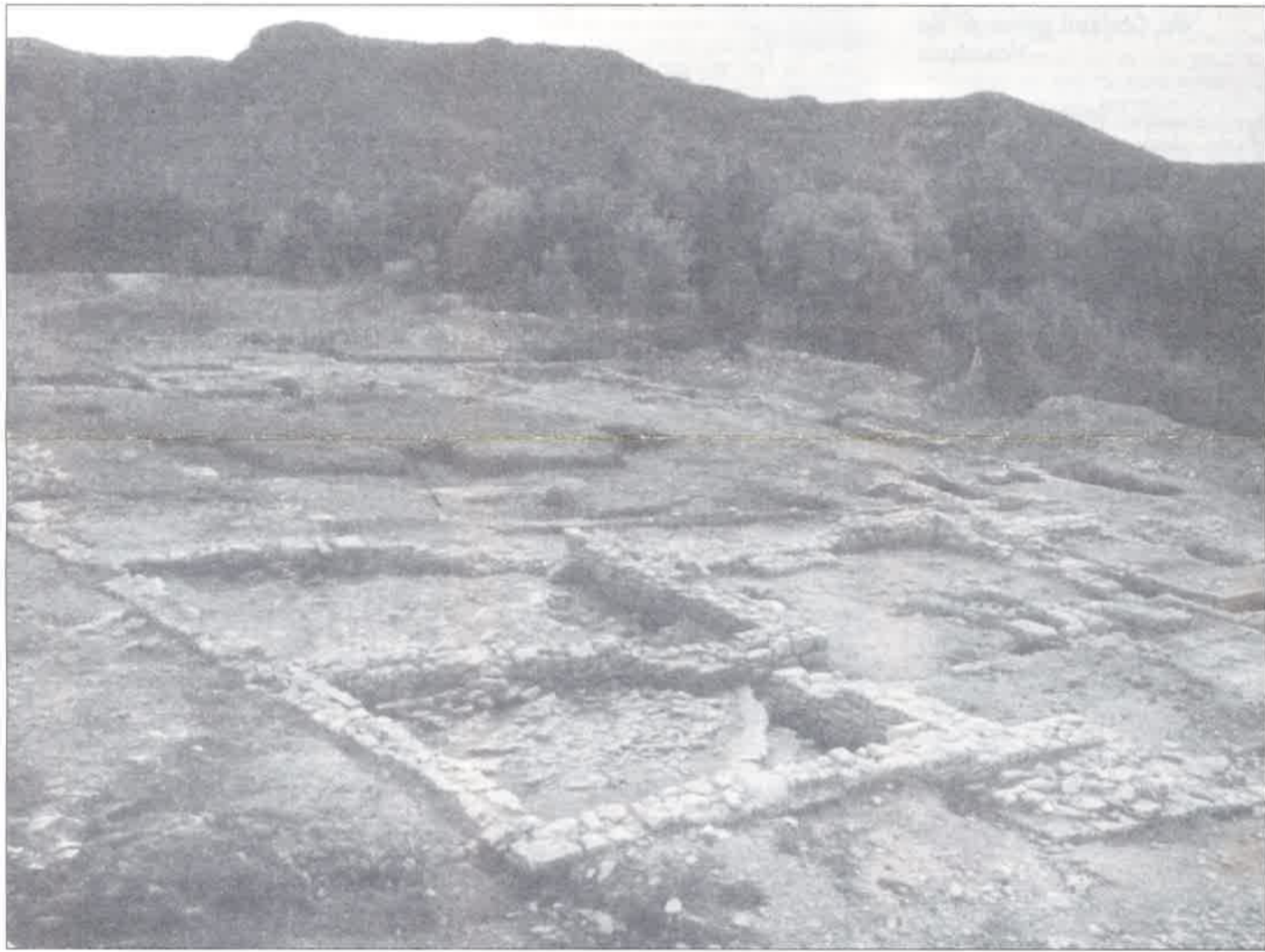
BUOUX, les CROTTES : vue générale du site.