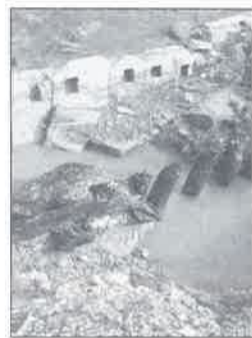
VAISON LA ROMAINE: Dalles et pieux mis au jour par la crue de l'Ouvèze.