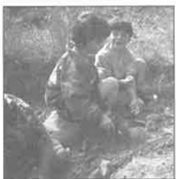
Quelques remarques d'enfants recueillies sur le chantier archéologique:

De la pratique de la fouille: - Fouille à plat sinon tu vas faire des trous! - Tu déterres pas, elle a dit Romaine, nettoie et fouille plus loin.