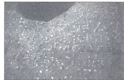
CAVAILLON: sol incrusté de galets.

Elles nous révèlent notamment que le cloître est en grande partie détruit vers 1815 et que sa disparition permet l'ouverture de la rue du Couvent. L'aspect général du quartier est désormais celui que l'on connaissait à la veille de l'ouverture des fouilles et du programme de rénovation de l'habitat.